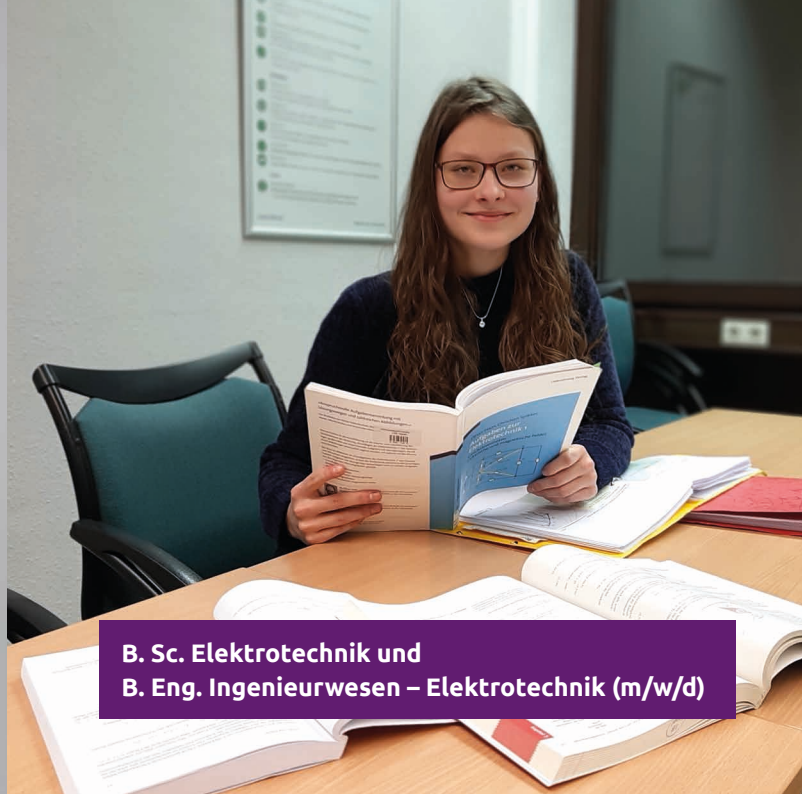
B. Sc. Elektrotechnik und B. Eng. Ingenieurwesen – Elektrotechnik (m/w/d)