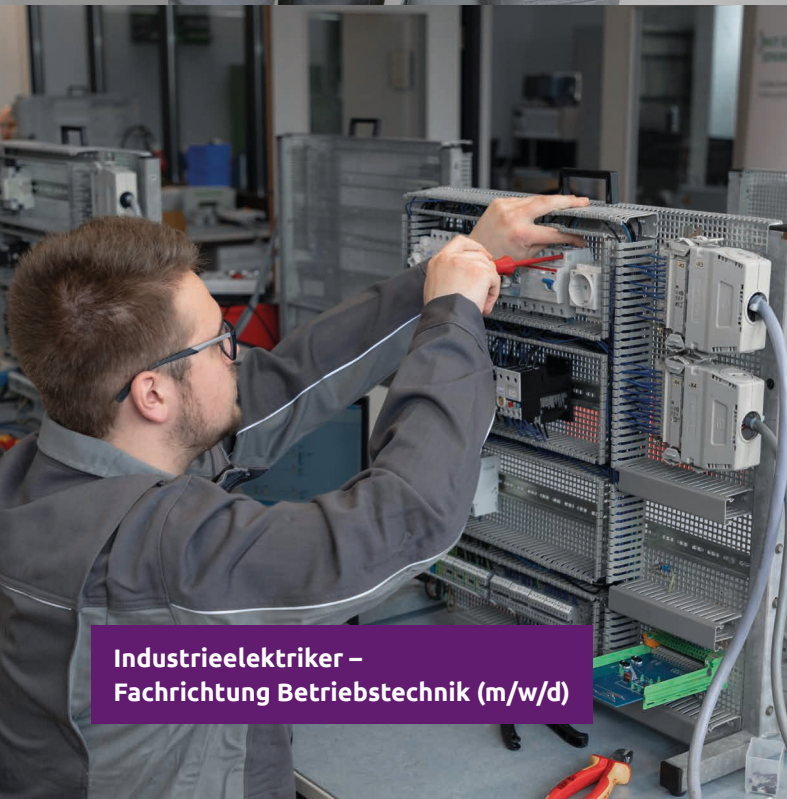
Industrieelektriker – Fachrichtung Betriebstechnik (m/w/d)