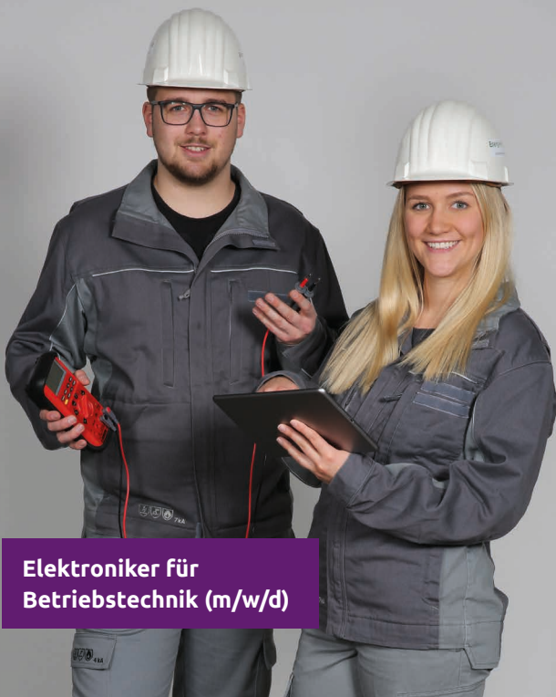
Elektroniker für Betriebstechnik (m/w/d)