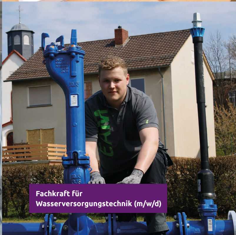
Fachkraft für Wasserversorgungstechnik (m/w/d)